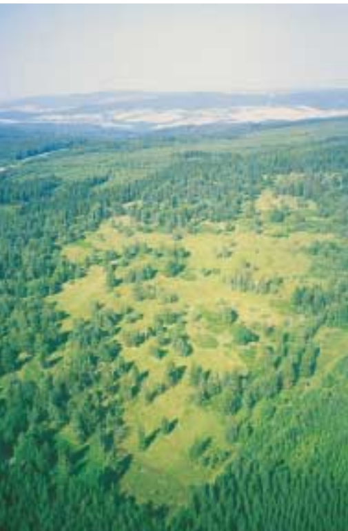
Blick nach Nordosten auf das Hühnerfeld, August 2001 (3)

Bereits vor ca. 400 Jahren begann die Stadt Hann. Münden, die Hochfläche des Kaufunger Waldes mit dem Hühnerfeld vom Rinderstall aus als Hutung für Jungvieh zu nutzen. 1785 gab es um das Hühnerfeld noch mehr als 300 ha solcher Allmendeweiden. Ende des 19. Jahrhunderts wurde der Gemeinschaftsbesitz des Hühnerfeldes parzelliert und im Laufe des 20. Jahrhunderts große Teile mit Fichten und Kiefern aufgeforstet. Heute sind im Hühnerfeld noch ca. 50 ha offene Flächen erhalten. Seit den 1950er Jahren kaufte der damalige Landkreis Münden Flächen im Hühnerfeld auf, inzwischen ist der Landkreis Göttingen Eigentümer fast aller Flächen. 1968 wurde das Hühnerfeld als Naturschutzgebiet ausgewiesen.