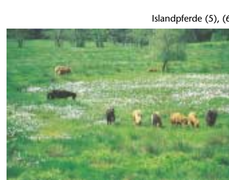
Islandpferde (5), (6)

Islandpferde werden von Anfang Juni bis Ende August ins Hühnerfeld getrieben, fressen das Pfeifengras ab und schädigen den Adlerfarn vor allem durch Tritt. Seit Beginn der Beweidung 1993 wurden die großen Adlerfarnflächen deutlich verkleinert. Mehrjährige Adlerfarn-Mahd auf Versuchsflächen reduzierte den Adlerfarn zwar auch, jedoch etablierten sich hier längst nicht so schnell andere Pflanzenarten, wie in beweideten Flächen.