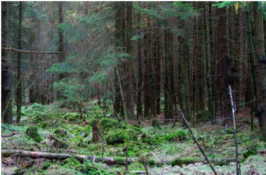
Abb. 3: Bis Anfang 2020 war das Federbruch-Quellmoor von einem dunklen, krautschichtarmen Fichtenbestand bewachsen.

waren bis Anfang 2020 von einem dichten, krautschichtarmen Fichtenbestand geprägt (Abb. 3). Nur an lichten Stellen hatten sich nasse Pfeifengras-Stadien mit Torfmoosen erhalten. So ist es wenig verwunderlich, dass das Gebiet lange Zeit ein Schattendasein führte und dass seine Bedeutung erst 2011 im Rahmen eines Moorgutachtens (KÜCHLER 2011) sowie 2017 bei der Entnahme eines über drei Meter langen Bohrkerns für eine pollen-