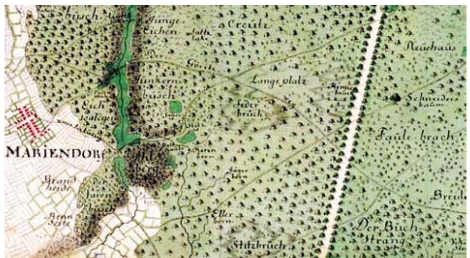
Abb. 2: Der Federbruch auf der Rüstmeister-Karte von 1724 (Bildmitte)

Das Federbruch-Quellmoor und ein Teil der angrenzenden Hangmoor-Bereiche