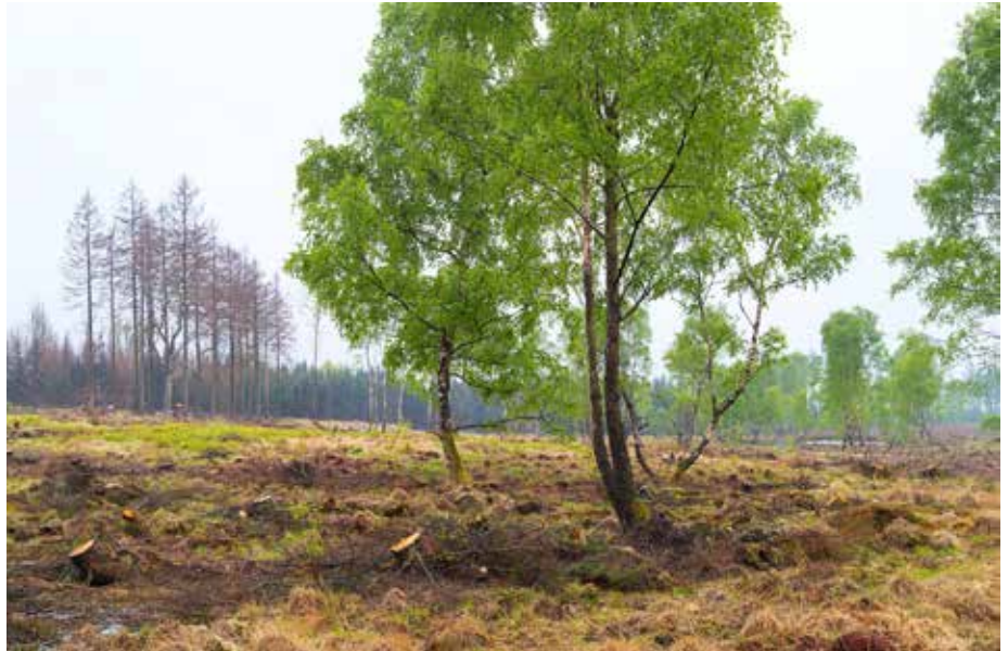
Abb. 5: Das Federbruch-Quellmoor nach der Fichten-Entnahme im Frühjahr 2020

Das Beispiel des Federbruchs zeigt, dass es noch immer gelingen kann, naturschutzfachlich herausragende Waldmoore wiederzuentdecken und gemeinsam mit verschiedenen Akteuren daran zu arbeiten, die Fehler der Vergangenheit – soweit möglich – zu korrigieren. Hierfür ist es notwendig, dass den Waldmooren