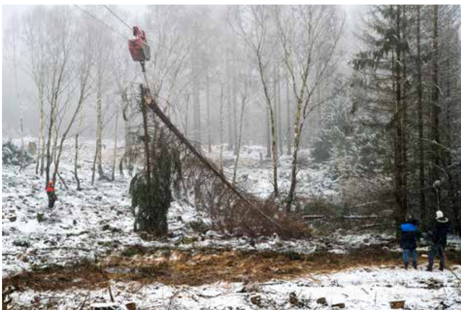
Abb. 4: Die Entnahme der Fichten mit der Seilkrananlage im Februar und März 2020 im Federbruch wurde teilweise von einem Kamerateam begleitet.

Für die bodenschonende Entnahme der Fichten war eine Seilkrananlage notwendig. Eine kostendeckende Umsetzung der Maßnahme war daher nicht denkbar. In dieser Situation gelang im Rahmen einer beispielgebenden Zusammenarbeit zwischen dem Forstamt Reinhardshagen